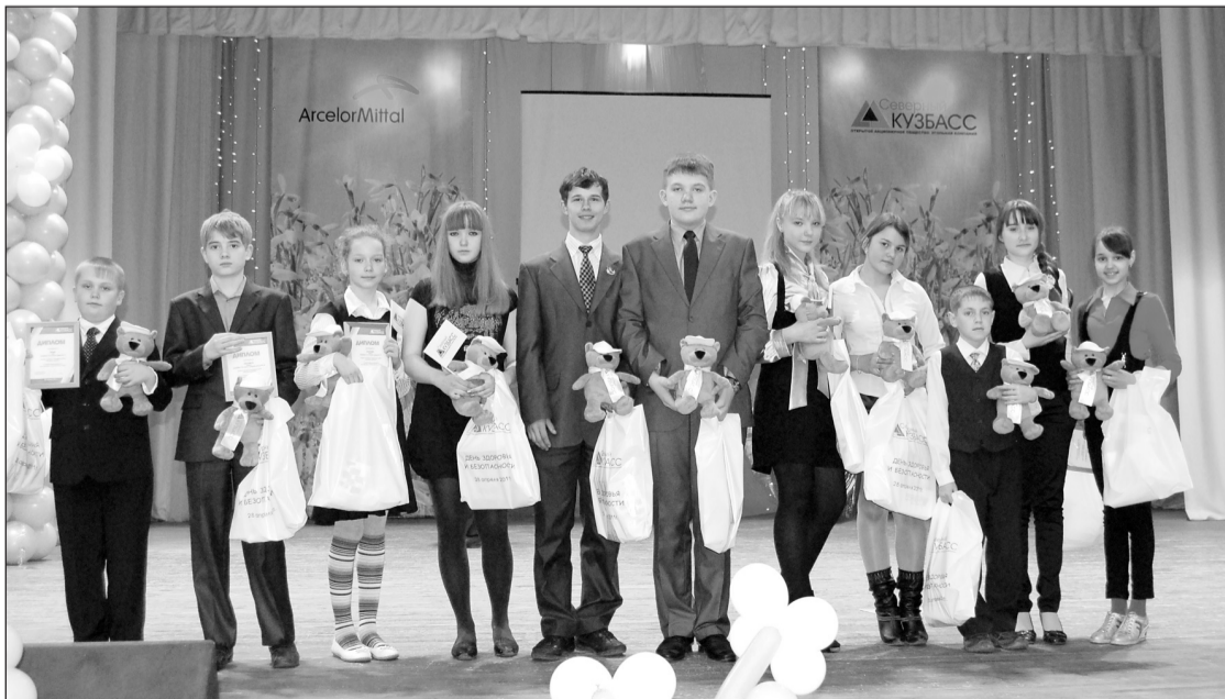
ЛАУРЕАТЫ КОНКУРСА «ПИСЬМО ШАХТЕРА»

– На мой взгляд, стандарты безопасности в нашей компании, это, прежде всего система, которая на сегодняшний день находится на максимальном уровне. Конечно, пределов в этом смысле нет, поэтому стоит развиваться в этом направлении. Самое главное, чтобы каждый человек, каждый работник понимал, что соблюдение мер безопасности труда необходимо.