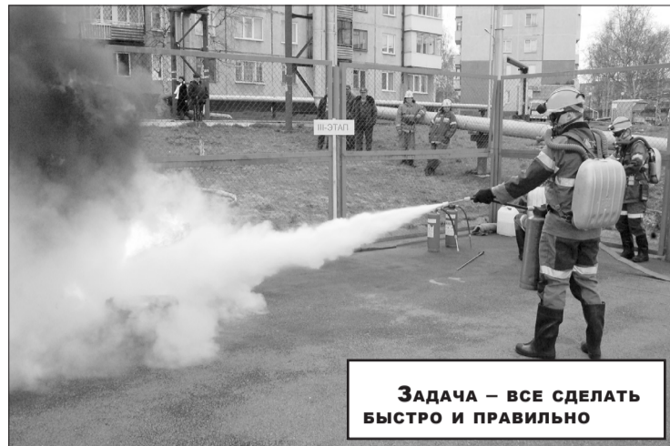
Задача – все сделать быстро и правильно

И не важно, что в данном случае роль пострадавшего человека играл манекен «Гоша». Действовать командам приходилось так, как если бы они оказались в условиях реальной чрезвычайной ситуации в шахте. Участники соревнований не замечали ни снега, ни ветра